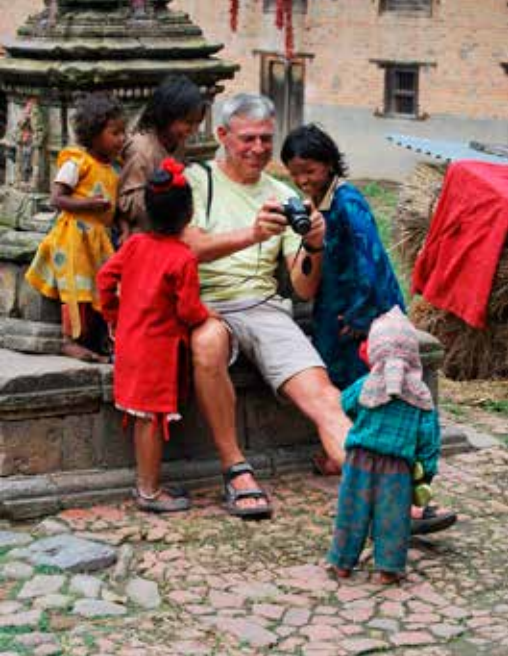
Op zoek naar de vele gezichten van India.